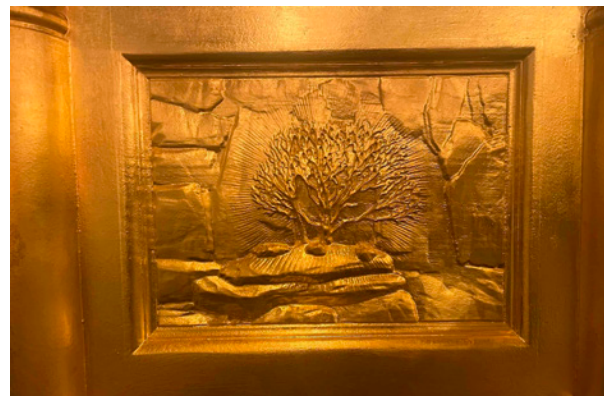
Juu: Kichaka kinachowaka. Chini: Kuvuka kwa Bahari ya Shamu

Je! Sanduku hii itakuwa katika Hekalu la Tatu ambalo litajengwa upya hivi karibuni?