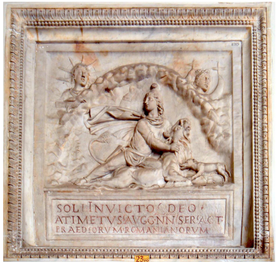
Picha ndogo ya Bas-inayoonyesha Mithras akimtazama Sol Invictus huku akimchinja fahali. Sol na Luna wanaonekana juu ya eneo.

ibada ya jua, wengi wa wenye-nguvu wa upagani walizaliwa karibu msimu wa baridi ambao uliwekwa kizamani Desemba 25. Siku ya kuzaliwa ya Mithra iliangukia Desemba 25. Mithra aliashiria jua, kama walivyo wenye-nguvu wengine wa mataifa kama Osiris, Hercules, na Bacchus, waliosemekana kuzaliwa siku hiyo. Ya kuvutia, mwokozi wa upagani wa Uchina, Zas, alizaliwa Desemba 25. (Umegundua mfanano wa karibu kwa neno Zeus la Kigiriki?) kuongezea mwenye-nguvu wa kimitisri Horus, mwenye-nguvu wa Kihindi Vishnu, na wa Ashuri Tammuz walikuwa na siku yao ya kuzaliwa Desemba 25, kama alivyo Mwenye-nguvu Dionysus wa Ugiriki, aliyekuwa utambulisho wa Zeus.