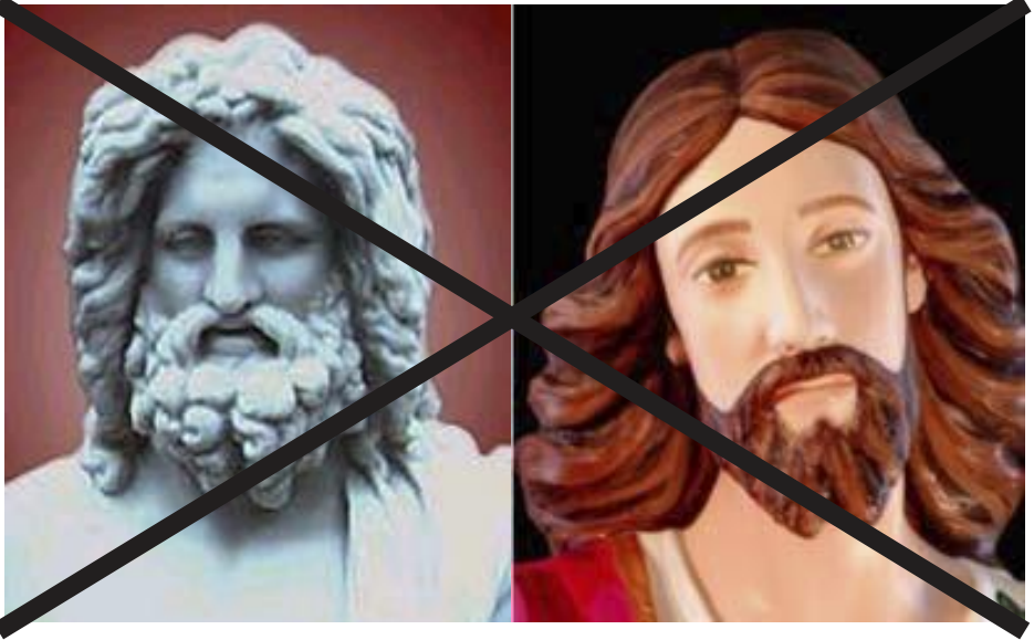
Une ressemblance FRAPPANTE: Le buste est celui de ZEUS, la statue est celle du JÉSUS Chrétien. Nous ne pouvons pas tolérer le mélange des Écritures et des traditions païennes.

trompés en se confiant à un nom qui ne contient aucun salut? Probablement, ils réalisent que leur position est précaire en ce qui concerne leur salut à moins qu'ils ne puissent prouver qu'il est acceptable pour le Tout-Puissant d'utiliser le nom commun Jésus pour le Sauveur. Alors ils commencent désespérément à fabriquer un moyen pour éviter d'avoir à utiliser le vrai Nom Hébreu pour le Messie révélant leur antisémitisme héréditaire.